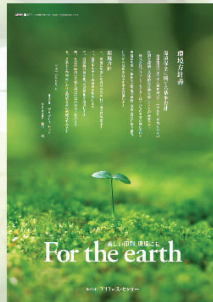
当社「環境方針ポスター」

環境負荷の少ないインキ・紙・印刷機を用いた「エコロジーカレンダー」を開発し、販売しています。